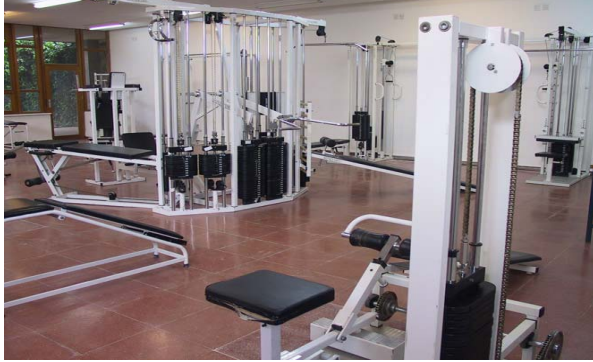
· Campo de fútbol con pista de atletismo · Pabellón Cubierto doble