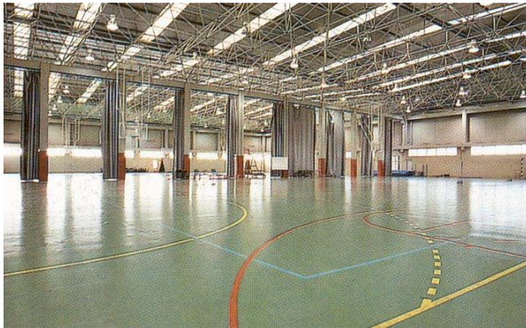
· Campo de rugby de hierba natural