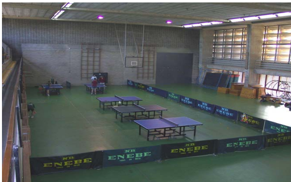
· Tatamis para Deportes de Combate