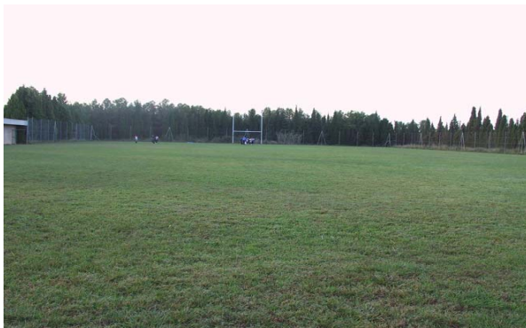
· Piscina cubierta de 25 metros y 6 calles