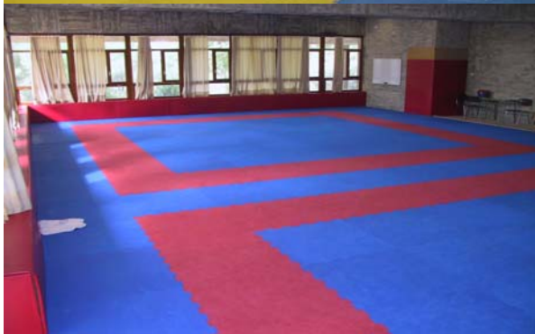
· Sala de Fisioterapia